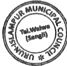
Chief Officer Islampur municipal council Islampur

It is emphasized that the sole responsibility for maintaining hygienic sanitation conditions lies with the institution. The institution is responsible for regularly monitoring the water quality to ensure its safety and cleanliness. The council bears no responsibility for any incidents that may occur on the premises.